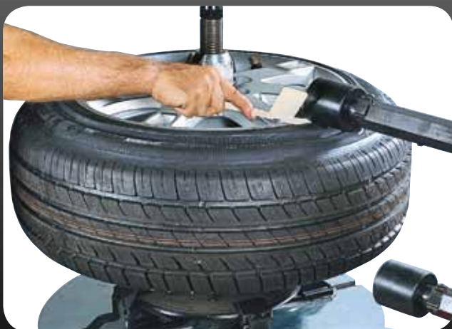
● INSERIMENTO DELLA REGLETTE ● FITTING THE "RÉGLETTE"