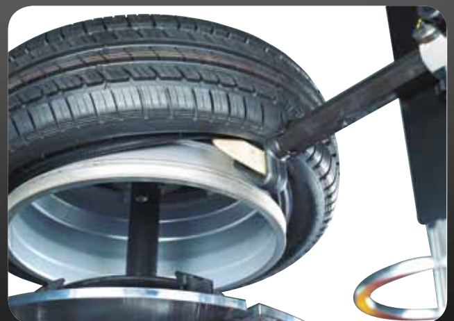
● FASE DI STALLONATURA, SMONTAGGIO RUOTA PAX ● BEAD BREAKING AND DEMOUNTING A PAX WHEEL