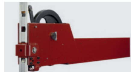
Parkeringsystem med paler