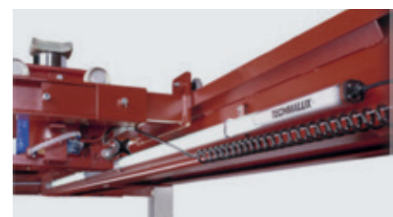
Hjælpeløfter og belysning