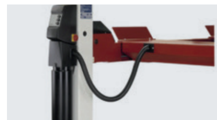
Pumpe og styring på forreste